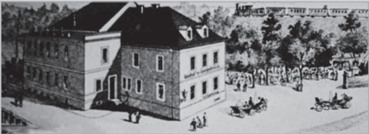
Gasthof Hauptstraße 4 um 1897 (Ausschnitt aus einer Kunstpostkarte)