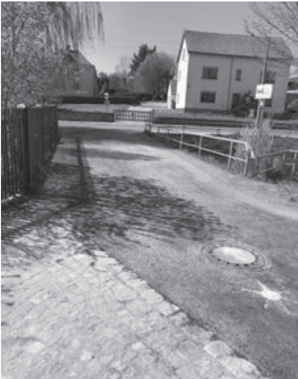
Steffi Marmodée SB Bauangelegenheiten/ Stellv. Verwaltungsstellenleiterin

Für 2021 kämpfen wir um einen Deckentausch im Bereich Hauptstraße 33-37. Die Mittel stehen bereit, doch die Vergabe bereitet noch große Probleme.